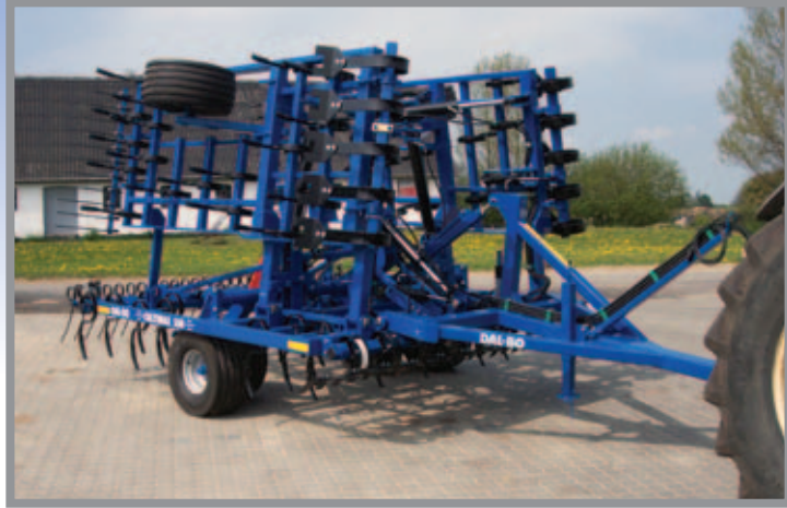
CultiMax 5.50 m

De fjedrende kulturharvetænder er 45x10 mm med ca. 8 cm rækkeafstand sikrer optimal bearbejdning af jorden.